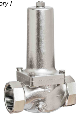
DN 40 - DN 50