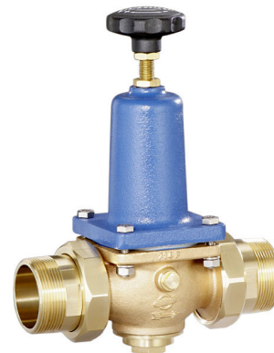
DN 40 - DN 65