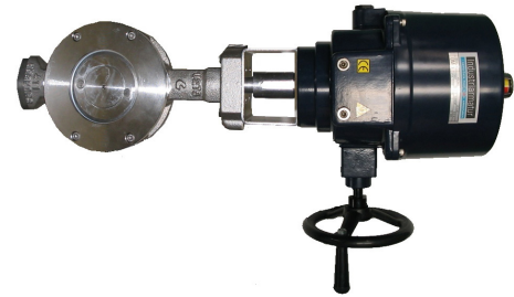
IA 411 med ELOM manöverdon

Montage bör ske med horisontell spindelaxel. Ventilen skall noga centreras mot flänsarna och normala flänspackningar skall användas. Ventilen är dubbelsidigt tätande och därför oberoende av strömningsriktningen, men montage med inlopp på axelsidan ger en något högre tätningskraft mot sätet.