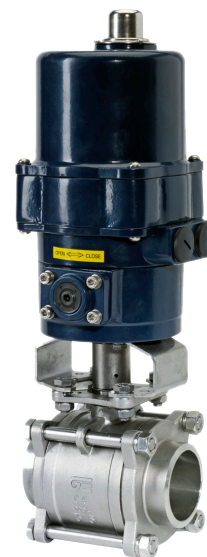
IA 2026 ELOM

Kulventil i tredelat utförande där alla delar är utbytbara och ändstyckena även fungerar som motflänsar. Homogen flytande kula. Spindeln är utblåsningssäker och packboxen är försedd med tallriksfjädrar som ansätter packboxtätningen för god täthet även efter många manövreringar. Som standard levereras ventilerna med montagefläns enligt ISO 5211 och med tätningar enligt nedan. Utrustad med ELOM manöverdon som är ett kraftigt manöverdon för on/off och reglering inom ett stort vridmomentsområde. Möjlighet till manuell manövrering via fyrkantfäste. Manöverdonet används inom en mängd olika branscher världen över där kraven på driftsäkerhet är höga.