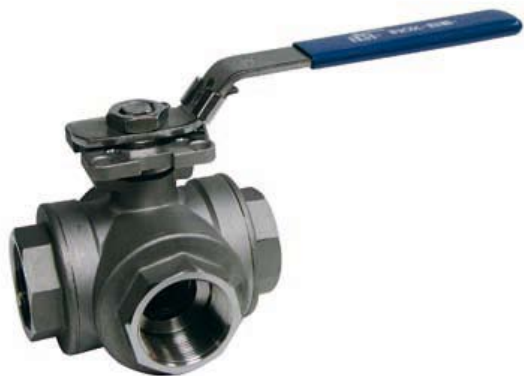
IA 2040, IA 2041